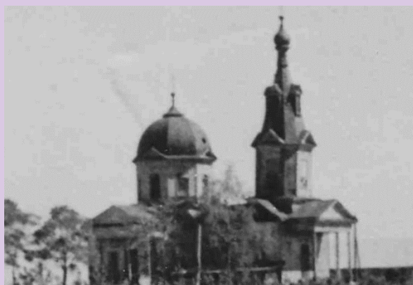
Иконы храма Казанской Божьей Матери